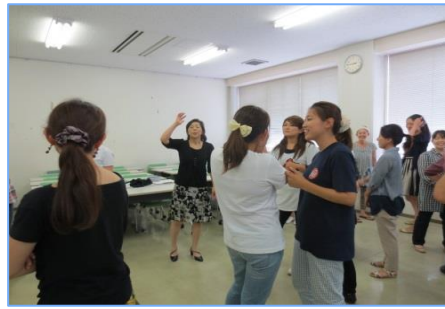
② 「体を使ってあそぼう！」 ～感覚という視点より～