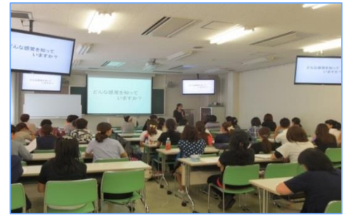
③ 「発達障害って？」 ～子どもの育ちを支えるために～