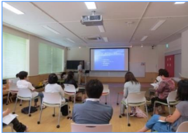
① 「健康な歯と口を守るために」