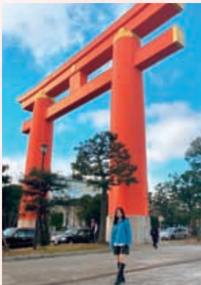
京都の平安神宮大鳥居前にて

また、京都市は歴史や文化に囲まれた街です。京都市の子どもと共に歴史や文化に親しみを持って学習し、子どもが楽しみながら学校に通うことができるような小学校教諭になれるよう、頑張りたいと思います。