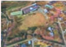
上空からの龍岡城