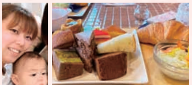
一宮市内でモーニング