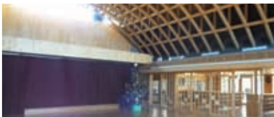
アーチ状の天井が特徴的な遊戯室