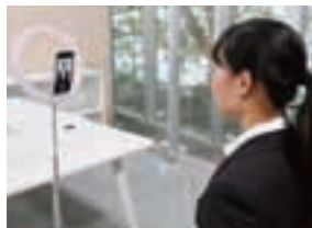
オンライン面接の様子

コロナ禍を乗り越えて岡女、岡短を巣立つ学生たちが、4月から保育現場、企業等でお世話になります。同窓生の皆様には、引き続き後輩たちに温かい眼差しをよろしくお願いたします。