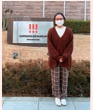
カップヌードルミュージアムの前にて