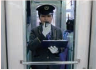
車内にてアナウンス中。

小田急電鉄に入社して2年。小田原駅サービス係として約6ヶ月勤務した後、車掌見習を経て現在は海老名車掌区で通勤列車の車掌を務めています。車掌業務はドア開閉・アナウンス・空調管理・お客さまへのご案内など多岐に渡ります。安全・安心・快適な列車運行を支えるため、乗務中は気の抜けない時間が長く続きますが、1日の乗務が終わると大きな達成感を感じます。