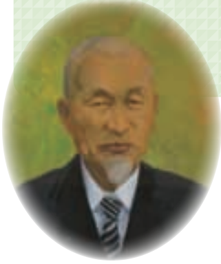
▲七回忌を記念して、元教授 上原 欽二氏が描かれた本多先生の肖像画