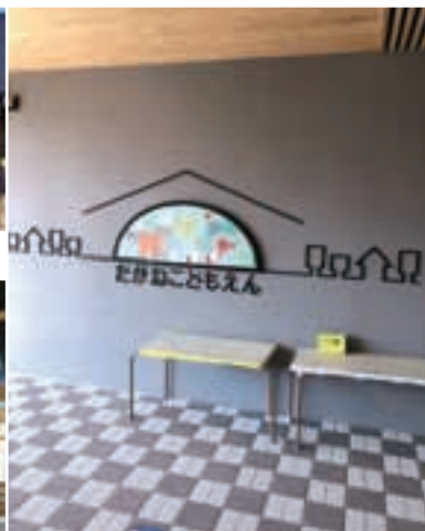
園児が親しみや愛着がもてる施設