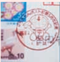
高岡駅限定記念消印 (デザインがよく変わります)