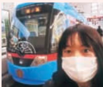
万葉線 高岡駅にて「ドラえもんトラム」