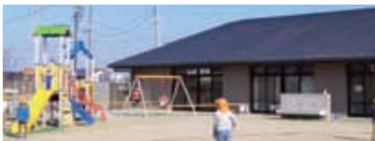
園舎は、通風・採光に配慮した平屋建て