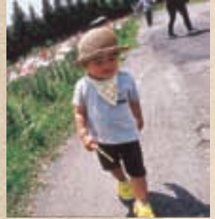
▲ ダイナランドのゆり園を散歩