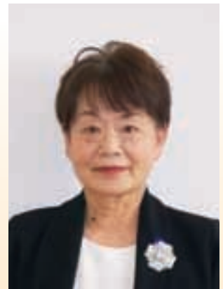
岡崎女子大学・岡崎女子短期大学同窓会 さかみちの会