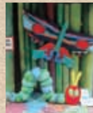
▲ 仲間と作った「はらぺこお虫」のオブジェ