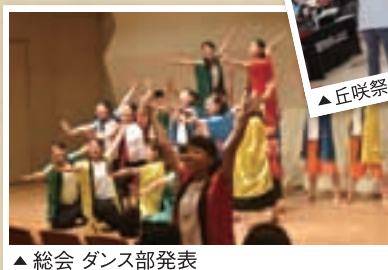
▲総会 ダンス部発表