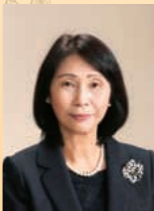
岡崎女子大学 岡崎女子短期大学

同窓生の皆様におかれましては、どうぞご健勝にますます充実した人生を歩んでくださいますことを祈念いたしております。そして、今年も多くの出会いで紡がれる1年になりますことを楽しみにしています。