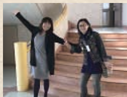
▲昔のままの小体育館にて