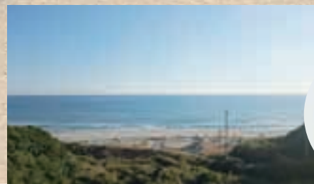
▲ 職場の屋上からは海が良く見えます

皆さん、こんにちは。気づけば、岡短を卒業して8年ほど経っている事に驚きます。私は、岡短を卒業してから地元豊橋市の介護福祉施設で介護福祉士として働いています。失敗ばかりしていた私ですが今ではベテラン職員と呼ばれるまでになり、他の職員さんからも頼りにされる事も増えてきました。私の勤めている施設は海に面しており、周りを森や山に囲まれた、とても静かで自然豊かな場所にあります。毎年、元旦には施設の利用者様と一緒に屋上へ行き、初日の出を拝みます。地平線から昇る日の出はとても綺麗です。仕事はとても大変ですが日々、充実した生活を送っています。また、その傍らで趣味としてアクセサリー作りなども行っており、大学祭で販売をさせていただいています。興味がある方は是非、遊びに来てくださいね。