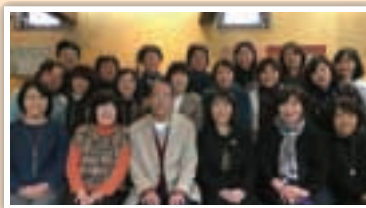
岡崎女子短期大学 幼児教育学科第一部 15回生