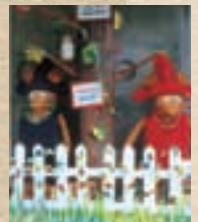
▲ 仲間と作った「ぐりとぐら」のオブジェ