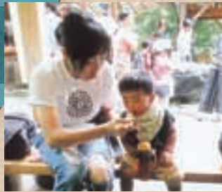
▲ 流しそうめんおいしいね