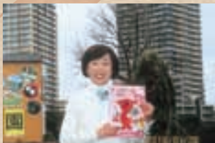
▲ チーナ君を手に高層マンションの前にて

未だ子供達とは縁とざれる事なく楽しい日々を送っています。さて私の住んでいる千葉市美浜区は埋め立て地で高層マンションが数多く建ち並び、綺麗な街並です。周りには、マリスタジアム、幕張メッセ、ディズニーランド、臨海水族園、大型ショッピングモールも新たに登場し、活気に満ちあふれた地域です。また、2020年にはオリンピック会場にも使用される予定です。まだまだ発展をくり広げるこの地で、さらに充実した日々を送っていきたくと思っています。