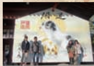
▲橿原神宮の巨大な絵馬の前で家族写真

奈良に来たときは東大寺や奈良公園はもちろん、橿原神宮や五條市にも一度訪れてみてくださいね。