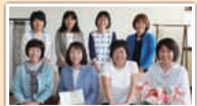
岡崎女子短期大学 幼児教育学科第一部 18回生