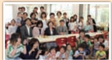
岡崎女子短期大学 初等教育学科 33回生