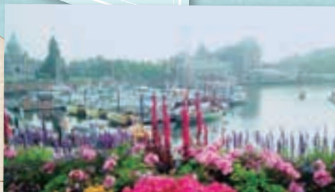
春夏の港の景色は最高▶

必須の日々でしたが、現在は念願の保育園で働かせてもらっています(時々子どもに発音の訂正をされながらですが)。こちらの子どもたちはとにかく体を動かすのが大好き!製作物も個性的で面白い。今はマイケルジャクソンのダンスパーティーが気に入りの遊びのようです。日本での経験を生かしつつ、こちらならではの文化を吸収して貴重な日々を過ごしたいと思います。紅茶、アウトドア、お花、アザラシ、リスが好きな方は機会があればぜひお越しください!