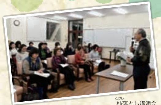
こけら 柿落とし講演会