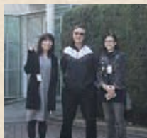
▲懐かしの真木先生と