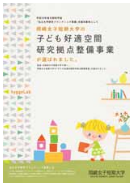
※詳しくは同封のチラシをご覧ください。