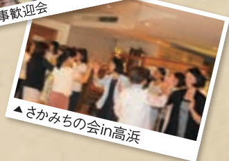
▲さかみちの会in高浜