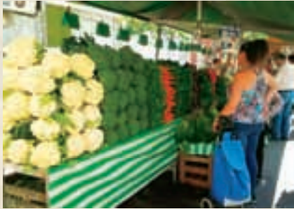
▲「フェイラ」と言われる露店市