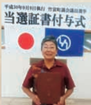
▲竹富町議会議員当選!

私が嫁いだ42年前は黒島全体が、林で覆われ牧草も生えず畜産は大変!しかし、石を砕き土に変えるスタビライザーの導入で、今は島全体が牧場です!黒島は人口約210人に対し牛3,000頭の畜産の島、1歳未満の優良仔牛を出荷します。