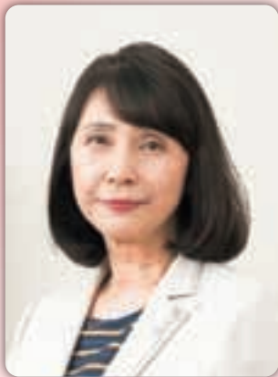
岡崎女子大学 岡崎女子短期大学