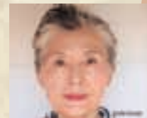
◀ドアップで白髪のおばさん古希を迎えます!孫息子が撮りました!