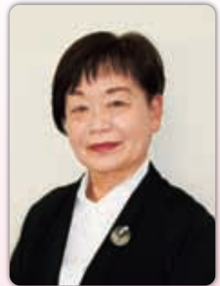
岡崎女子大学・岡崎女子短期大学同窓会 さかみちの会