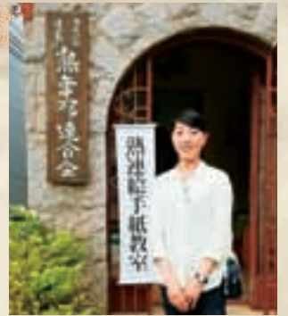
▲ 配属先の熟年クラブ連合会

2年の任期ですが、日本を離れブラジルで暮らす選択をした方たちの心に寄り添い精一杯活動をしたいと思います。