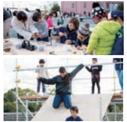
冒険遊び場「プレイパーク」の実践

研究概要や事業に関わる新しい情報については、岡崎女子短期大学「hyggeLab特設webサイト」上にて随時紹介しております。岡崎女子短期大学webサイト上にあるhyggeLab特設サイトのバナーをクリックし、ぜひサイトへアクセスしてみてください。