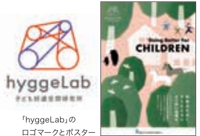
「hyggeLab」の ロゴマークとポスター