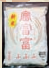
▲富山米の新品種「富富富(ふふふ)」

特に見所の1つでもある3,000m級の山々が連なる立山連峰は市中どこからでも見えるのですが、目に入る度に「今日も山は綺麗だ」と感動できます。その立山からの雪解け水を利用して作り出された富山米の新品種「富富富」(ふふふ)は、甘味・旨味が際立ち美味しいです。一度ご賞味あれ！