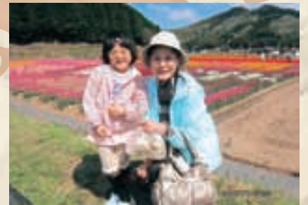
▲「豊岡市但東町のチューリップまつりに」孫と2人で