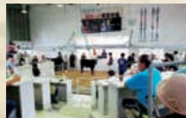
◀黒島の優良仔牛の出荷

回目を迎え2月24日開催!私はイベント部で黒ちゃん島ちゃんショーと子どもステージの担当です。黒ちゃん島ちゃんとは牛祭りのキャラクターで10周年を記念し公募したものの予算が無く発注できない為、材料費で私が手作りした着ぐるみ(笑)。牛祭りは参加型イベントで牛との綱引き・牧草ロールのゲームやペイントコンテスト・仔牛のミルクやりや牛の図画コン・夢の牛一頭が当たる抽選会他盛り沢山!テナントは牛肉料理と……。この日だけで人口が15倍になる牛づくしの黒島へワーリタボーリ!