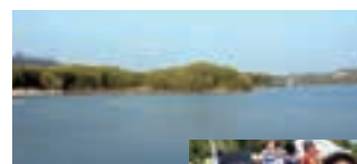
ボート大会が行われる愛知池

私の住んでいる東郷町は昔は農業の町として栄え、今も沢山の自然が残っています。平成6年に国民体育大会のボート競技が愛知池で行われたことをきっかけに「レガッタ」を東郷町のスポーツとしており、毎年大会が行われています。私自身も職場で知り合った方々とチームを組み、大会が行われている時には参加し自然を感じています。小さな町ですが「ららぽーと東郷」も開業し楽しめるスポットも増えました。近くを通る際はぜひ遊びに来てみてください。