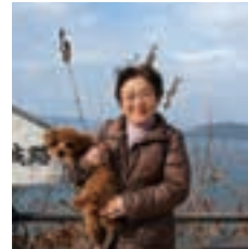
屋島山頂より瀬戸の多島美

又、瀬戸内海には沢山の島がありとても美しいです。その多島美を活かして、2010年から3年に1度瀬戸内国際芸術祭が行われるようになり、世界的にも有名になっています。そんな恵まれた環境と人のいる高松で私は今、保育所を定年退職してから子育て支援や地域の子供達の見守り等、子育て親子へのボランティア活動をしています。日本で一番小さい県ですが、魅力一杯の香川へおいでませ!