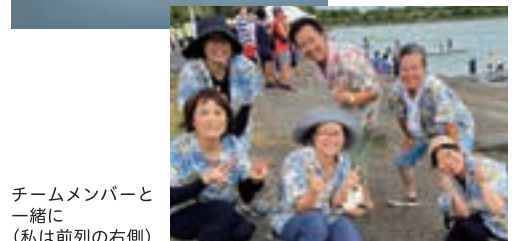
チームメンバーと一緒に (私は前列の右側)