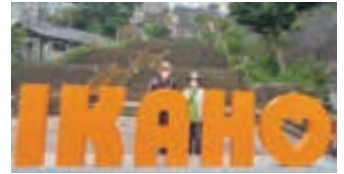
伊香保温泉石段前にて