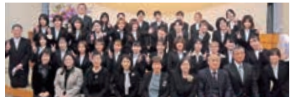
2月22日にお集まりいただいた方々

令和5年3月末をもって37年間の歴史に幕を閉じました。懐かしい映像や卒業生代表の講演があり、当時の様子が鮮明に思い出されました。最後の卒業生と来賓の方、教職員の参列、ミュージックバンド有志による演奏により、温かい会となりました。