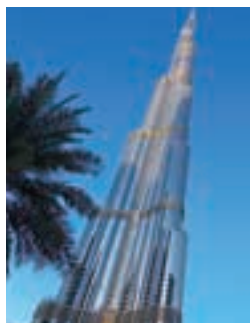
世界一高いビル ブルジュ・ハリファ