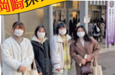
大河ドラマ「どうする家康」東海プレミアリレー in 岡崎に参加

私は、「岡崎探検隊!!」として、岡崎の魅力を多くの方々に伝えるために活動しています。「岡崎探検隊!!」は、岡崎市内4つの大学から選抜された23人のメンバーから成り立っており、岡崎市役所の方々のサポートのもと、活動が進んでいます。現在、4つのグループに分かれ、各グループでゆかりの地やスイーツなどの1つのカテゴリーに絞って、岡崎の魅力を発信しています。グループごとにインスタグラムのアカウントを作成したのでぜひご覧ください。