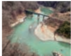
水面から80m上にかけてられた天龍峡大橋から見る天龍川と飯田線