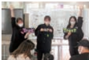
「ハロウィン」に参加「Trick or Treat!!」

岡崎市・岡崎市国際交流センターが主催し、本学の学生が協力して「多文化親子サロン」がスタートしました。