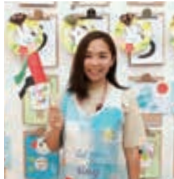
子ども達が作った作品を背景に