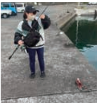
柏島にて釣れたミノカサゴ